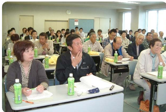
(熱心に聞き入る参加者の皆さん)